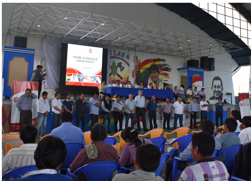
Directores de las entidades dependientes del ministerio en la Rendición de cuentas.

En su saludo de bienvenida el Ministro afirmó “Hay muchas cosas que dicen de la gestión de nuestro