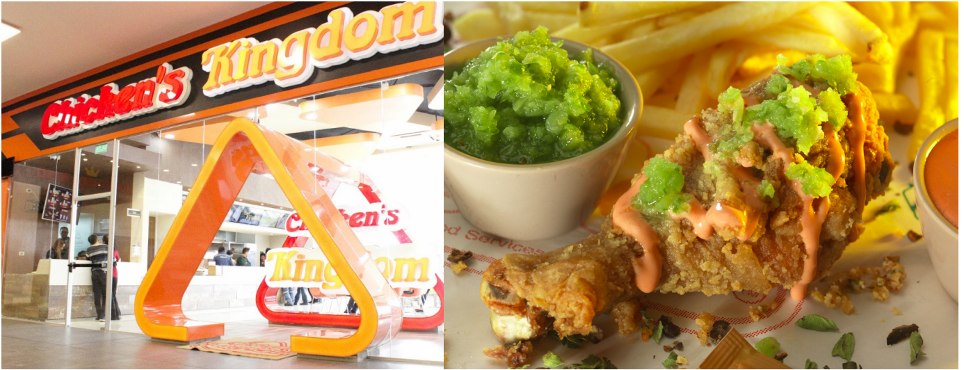
Ingreso de uno de los restaurantes de Chiken´s Kingdom y uno de sus productos.

“Sabor y Originalidad nos hacen Diferentes”