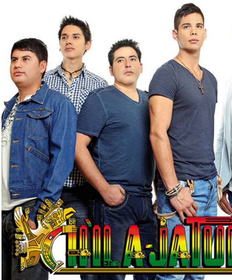
Grupo Ch'ila Jatun

Sus composiciones “tienen un contenido social, inspiradas en la situación de nuestro país, también están dirigidas al amor, inspiradas en nuestras musas como son las