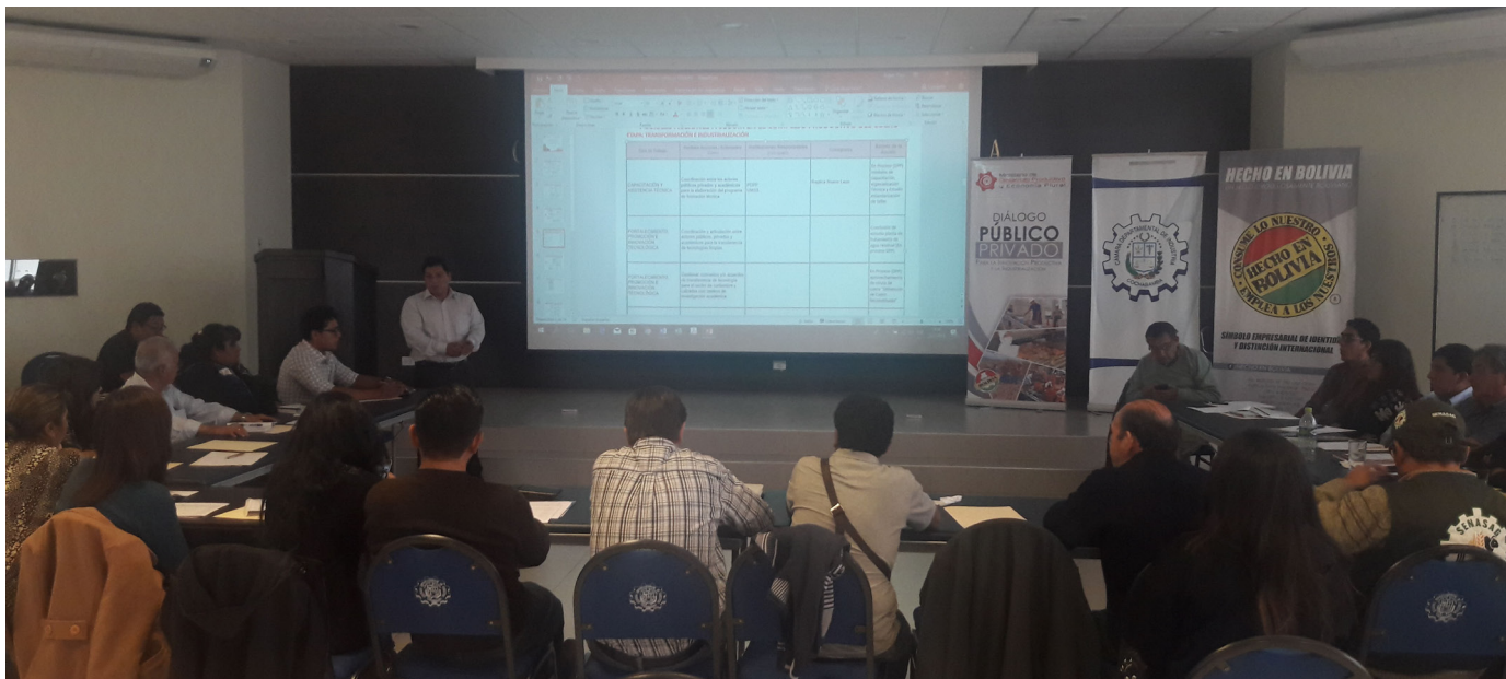
Taller de articulación interinstitucional de los complejos productivos de Cuero y Textiles