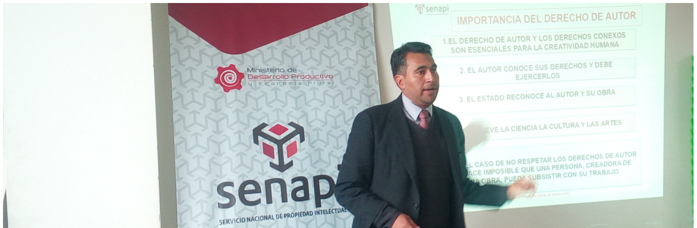
Técnico del Senapi durante la capacitación

El Senapi en la búsqueda de difundir la temática sobre propiedad intelectual y orientar para el registro de productos artesanales, realizó una capacitación sobre marcas individuales y colectivas, patentes y derecho de autor a secretarios ejecutivos de las diferentes asociaciones que conforman el Consejo Central de Federaciones y Asociaciones de Artesanos de El Alto (Cocedal).