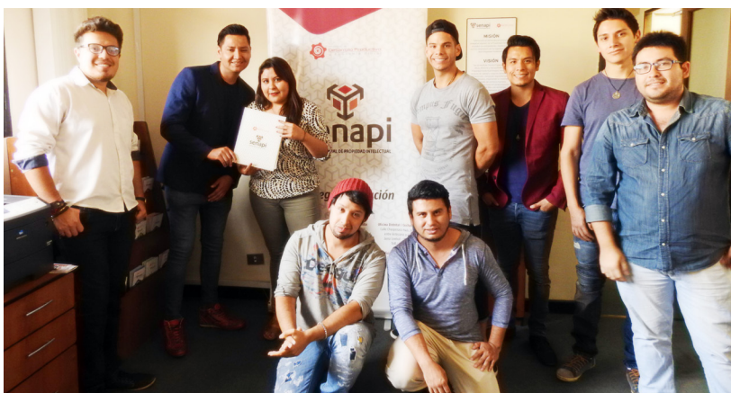
El grupo Ch'ila Jatun durante el registro de sus canciones en la oficina del Senapi Cochabamba

"Considero importante proteger el derecho intelectual de mis composiciones, porque al registrar mis canciones, estoy impidiendo que diferentes grupos o cantautores se apropien de la autoría de mis temas".