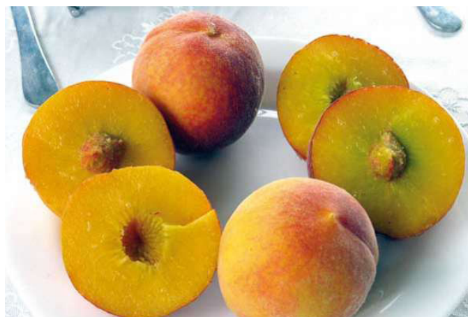
Duraznos de Luribay

Son indicaciones geográficas cuya función consiste en brindar información sobre el lugar en el que el correspondiente producto es extraído, producido, cultivado o elaborado. Ejemplos: